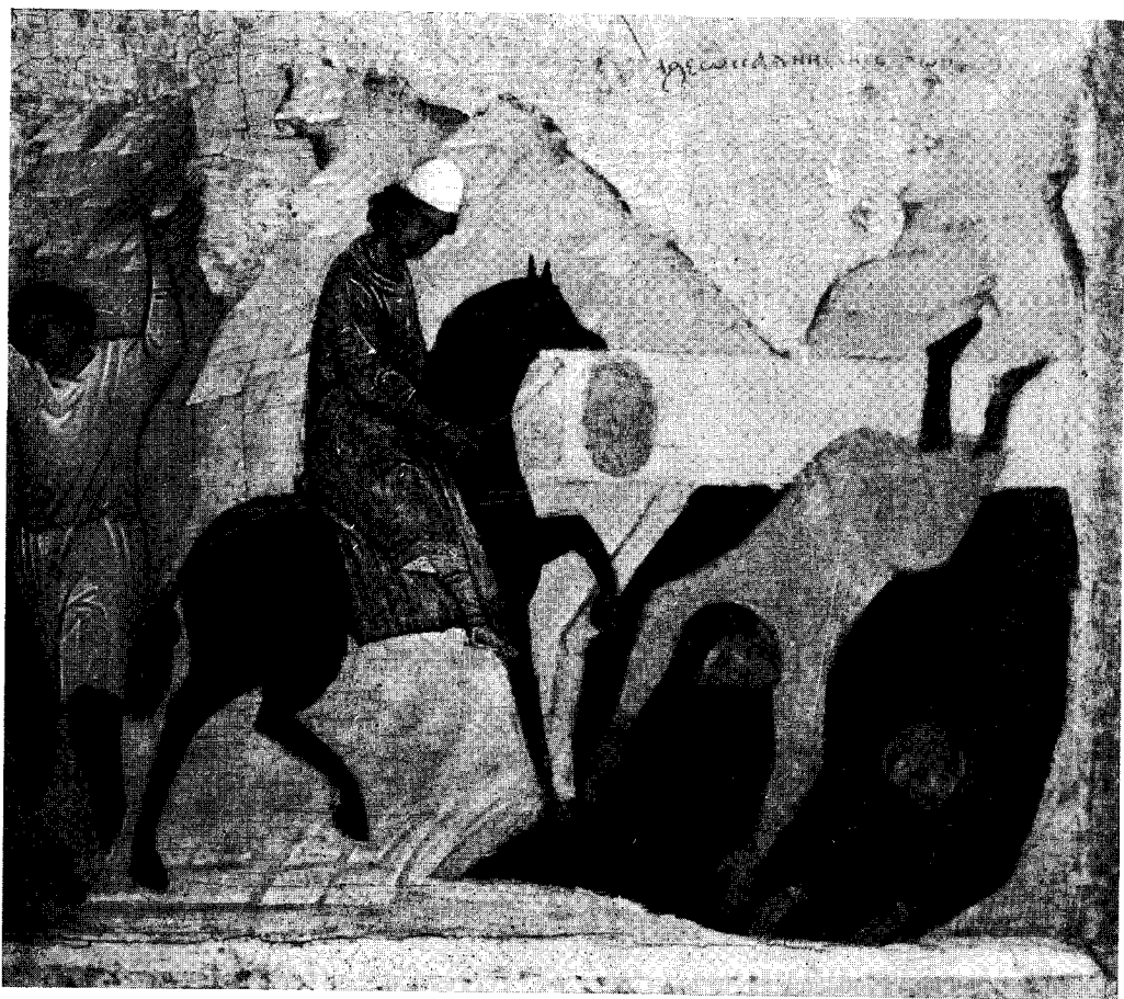
Рис. 1. Гибель Святополка. Клеймо иконы Бориса, Владимира и Глеба с житием. Начало XVI в. (Гос. Третьяковская галерея, № 14247, № 410 по каталогу).