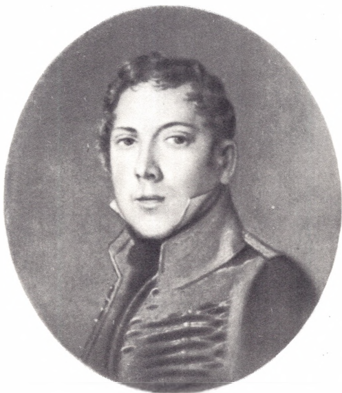
Е. А. Баратынский. Рисунок неизвестного художника (1828 г.)