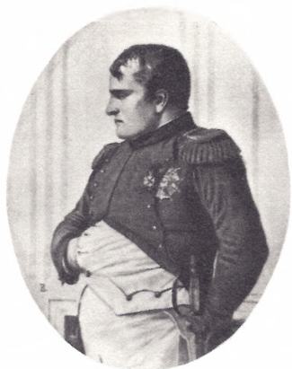
Наполеон в Петровском дворце