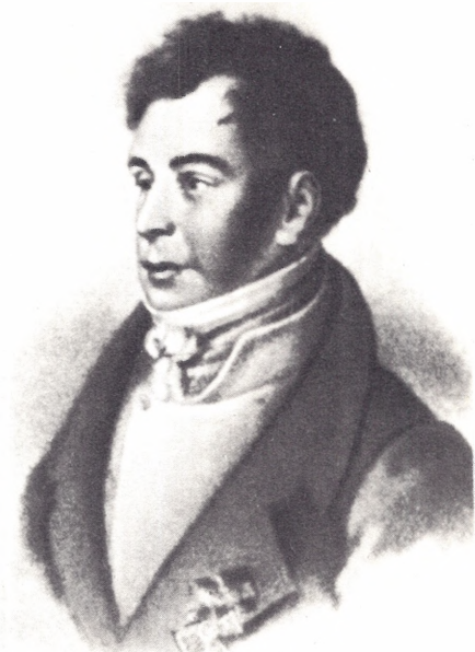
Н. И. Гнедич