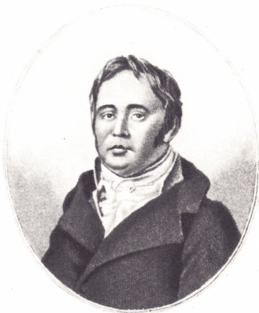
И. А. Крылов