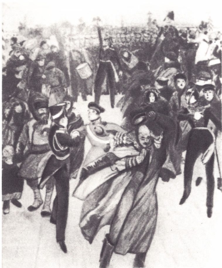
14 декабря 1825 г. на Сенатской площади. Акварель Д. Н. Кардовского