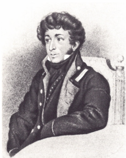
К. Н. Батюшков