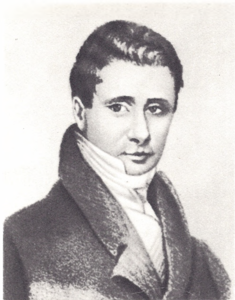
Н. И. Тургенев