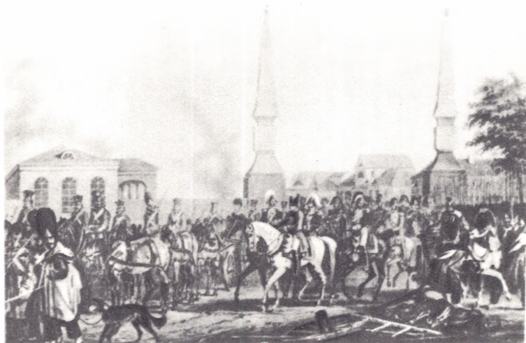
У Калужских ворот, 19 октября 1812 г.