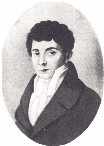
К. Ф. Рылов в 1815 г. Портрет работы Белла