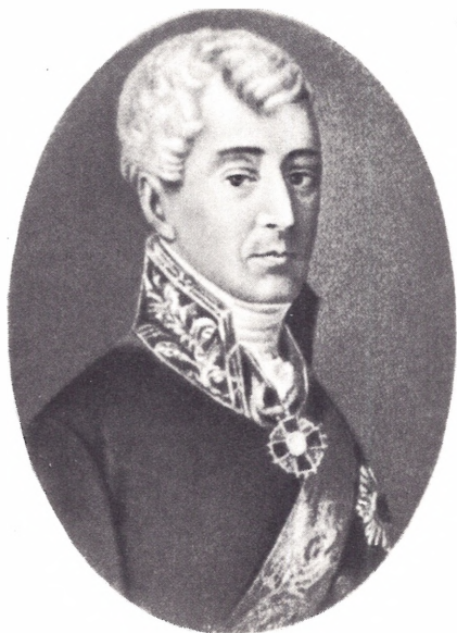
И. И. Дмитриев