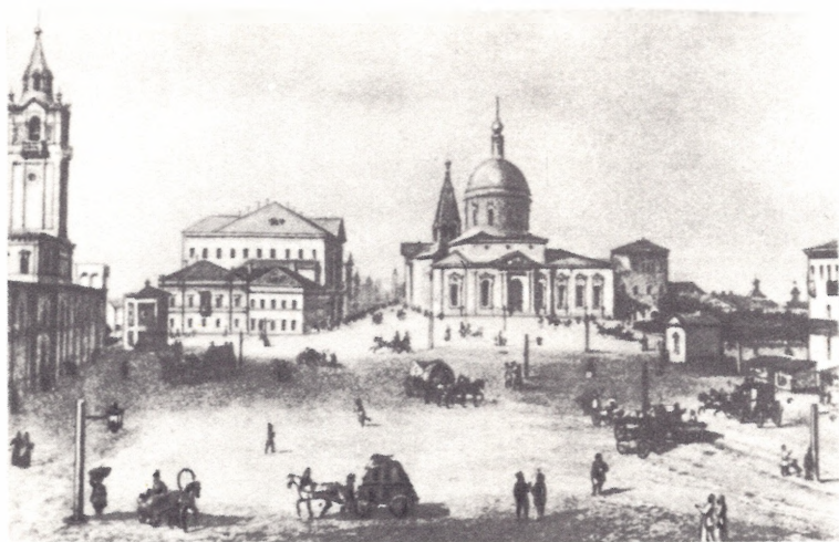
Страстная площадь в Москве. Рис. А. Шарлеманя. Первая половина XIX в.

Страстная площадь в Москве. Рисунок А. Шарлеманя. Первая половина XIX в. Пушкинский кабинет ИРЛИ