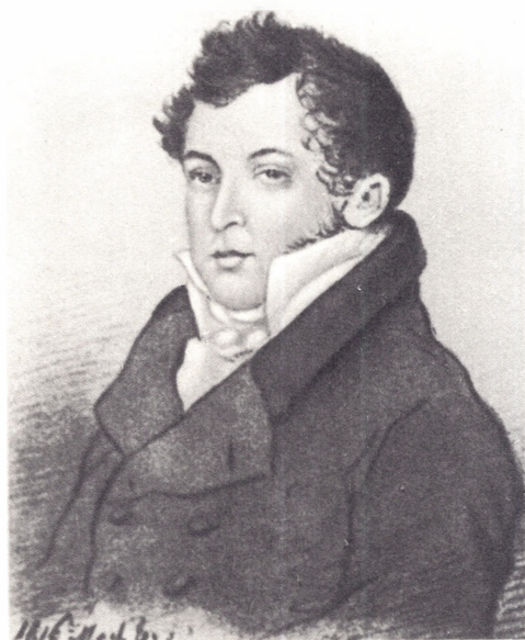
А. И. Тургенев