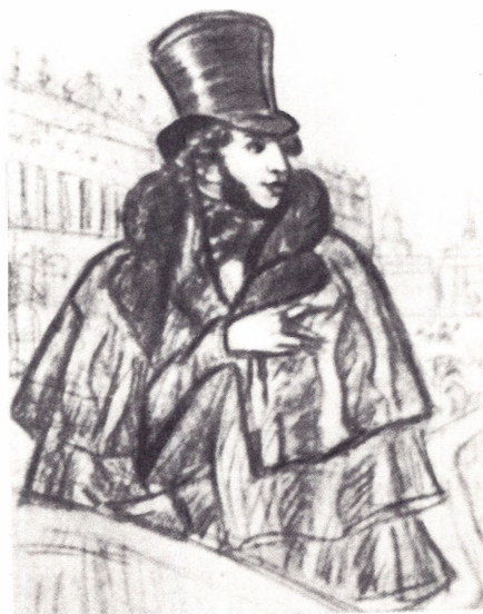
Пушкин в Петербурге. Рисунок Б. М. Кустодиева Пушкинский кабинет ИРЛИ