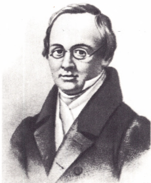
А. А. Дельвиг Пушкинский кабинет ИРЛИ