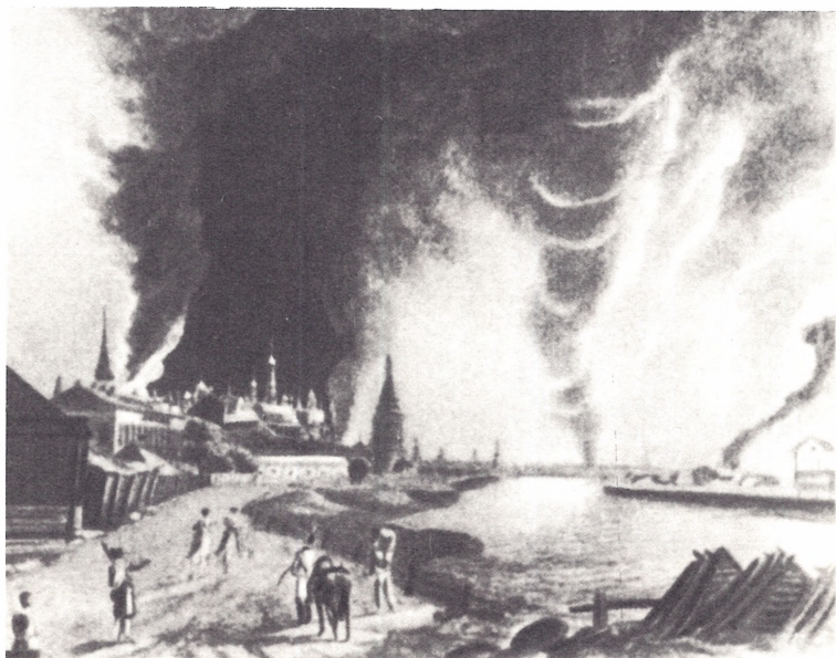
Пожар в Москве в 1812 г.

Рисунок неизвестного художника. Первая половина XIX в.