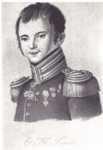
Ф. Н. Глинка