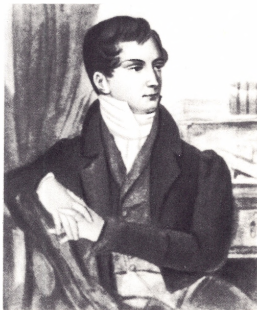
Д. В. Веневитинов Пушкинский кабинет ИРЛИ