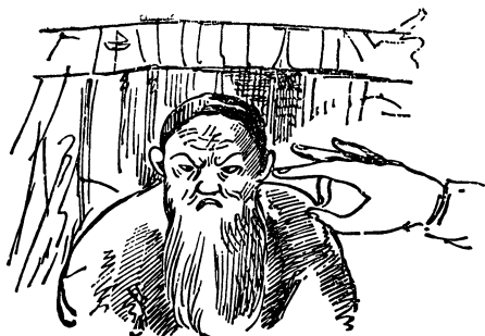
ПОП ПОД ЩЕЛЧКОМ. Рисунок А. С. Пушкина.

Понапружился, Приподнял кобылу, два шага шагнул, На третьем упал, ножки протянул. А Балда ему: «Глупый ты бес, Куда ж ты за нами полез? И руками-то снести не смог, А я, смотри, снесу промеж ног». Сел Балда на кобылку верхом, Да версту проскакал, так что пыль столбом. Испугался бесенок и к деду Пошел рассказывать про такую победу. Делать нечего — черти собрали оброк Да на Балду взвалили мешок. Идет Балда, побрякивает, А поп, завидя Балду, вскакивает, За попадью прячется, Со страху корячится. Балда его тут отыскал,