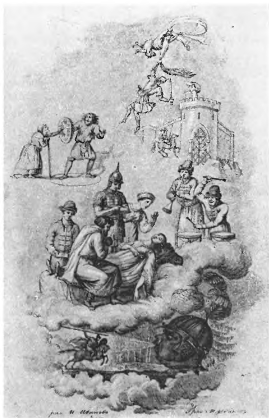
ФРОНТИСПИС ПЕРВОГО ИЗДАНИЯ ПОЭМЫ «РУСЛАН И ЛЮДМИЛА». 1820 г.