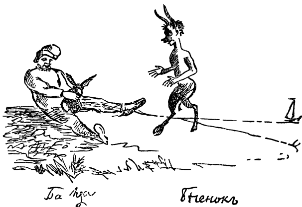
БАЛДА И БЕСЕНОК. Рисунок А. С. Пушкина.

Мне оброк по самой моей смерти; Лучшего б не надобно дохода, Да есть на них недоимки за три года. Как наешься ты своей полбы, Собери-ка с чертей оброк мне полный». Балда, с попом понапрасну не споря, Пошел, сел у берега моря; Там он стал веревку крутить Да конец ее в море мочить. Вот из моря вылез старый Бес: «Зачем ты, Балда, к нам залез?» — «Да вот веревкой хочу море мёрщить, Да вас, проклятое племя, корчить». Беса старого взяла тут унылость. «Скажи, за что такая немилость?» — «Как за что? Вы не плотите оброка,