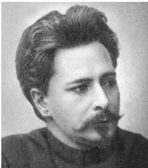
Л. Н. Андреев

Родился в семье землемера. С детских лет отличался страстным, неуравновешенным ха-