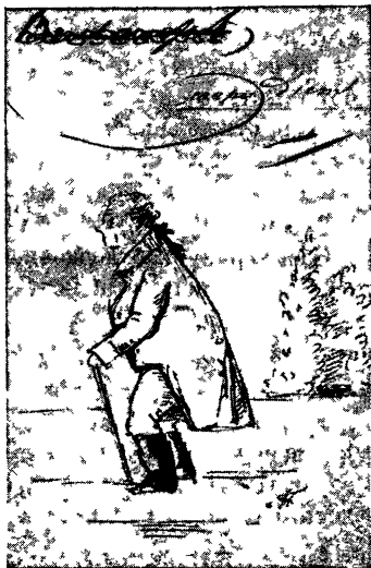
Князь Н. Б. Юсупов. Рис. Пушкина. (Воспроизводится впервые)

На первом листе этого автографа, который служит как бы оберткой для стихотворения, поэт написал сна-