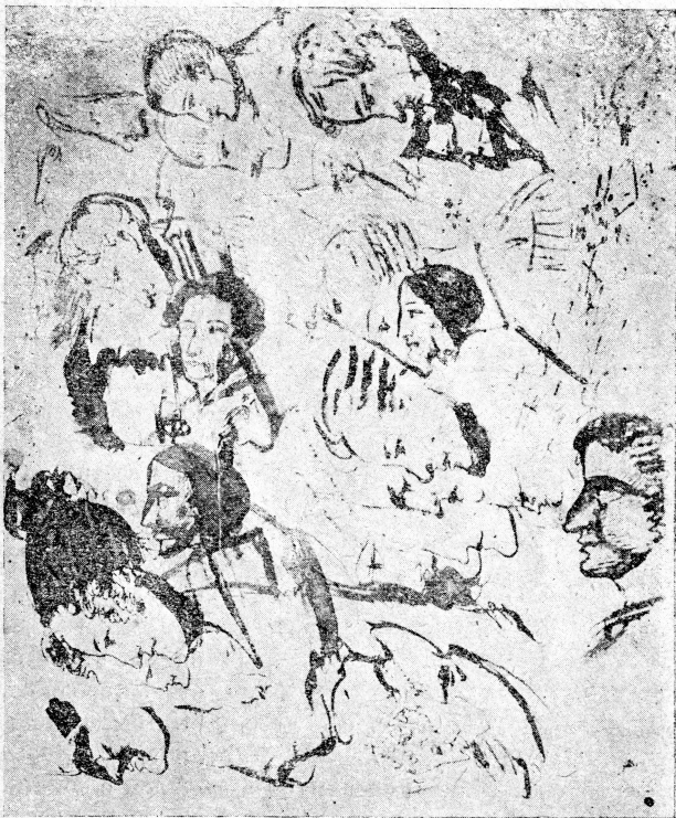
„Эскизы разных лиц, замечательных по 14 декабря 1824 г.“. (Воспроизводится непосредственно с подлинника).