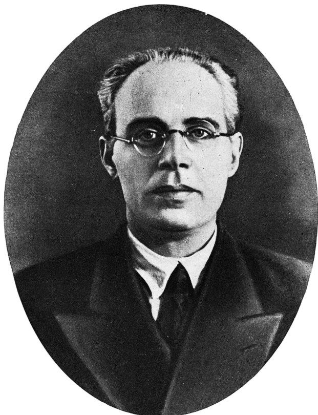
Л. Б. Модзалевский