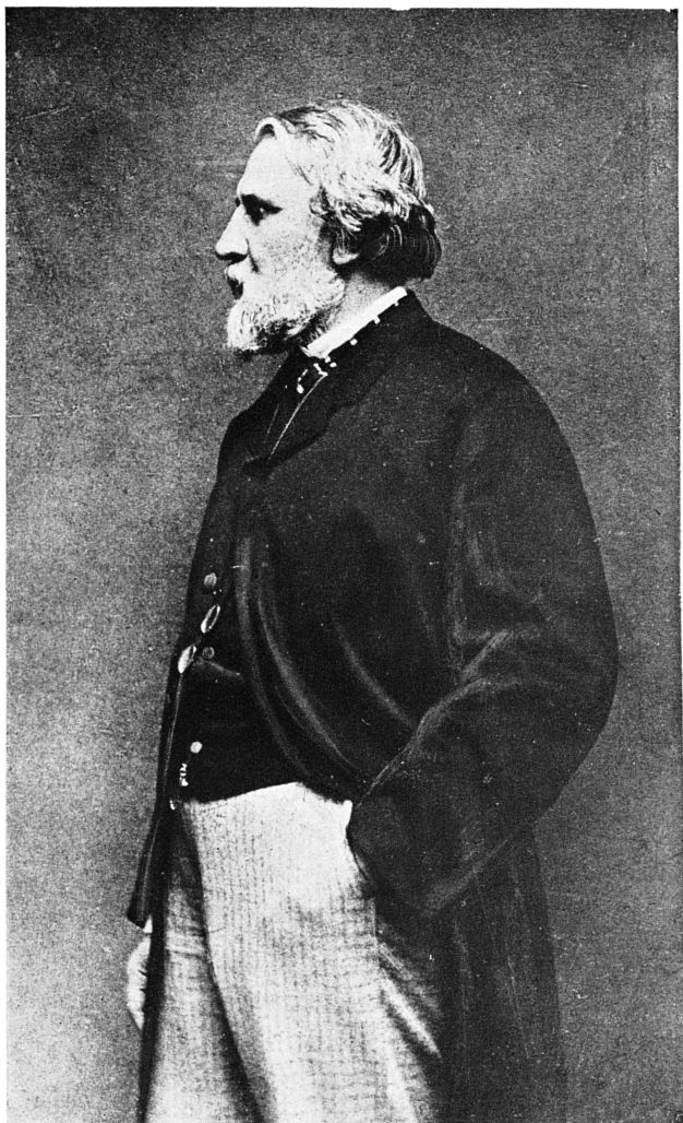
И. С. Тургенев, Фото Ет. Саржат, Париж, 1864 г.