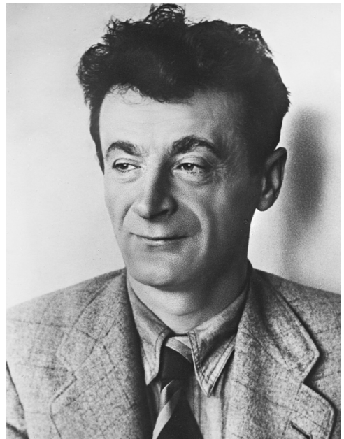
М. А. Светлов

Родился в бедной еврейской семье (отец был мелким ремесленником), в 1914–17 учился в 4-классном училище и одновременно служил «мальчиком» в фотографии и на товарной бирже. В 1917 в газ. «Голос солдата» было напечатано первое его стих., в 1919 стал комсомольцем, в 1920 — добровольцем-стрелком 1-го Екатеринославского территори-