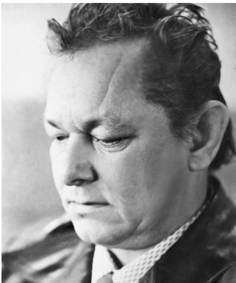
В. Д. Дудинцев

ДУДИНЦЕВ Владимир Дмитриевич [16(28).7.1918, Купянск Харьковской обл.— 23.7.1998, Москва] — прозаик.