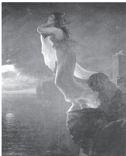
Ж.-А. Гро. «Сафо на Левкаде» (1801, Музей барона Жерара в Байо)

У его истоков стоит, может быть, самая известная (не считая Андромеды) «дева на скале» — древнегреческая поэтесса Сафо, которая, согласно преданию, бросилась с Левкадской скалы в море от несчастной любви к юноше Фаону. Этот трагический сюжет, еще со времен героиды Овидия занявший важнейшее место в легендарной биографии Сафо, 5 неоднократно становился объектом описания в литературных произведениях и предметом изображения на живописных полотнах. Особенную популярность он снискал в позднеклассическую и романтическую эпоху, когда были созданы такие известные полотна, как «Сафо на Левкадской скале» П.-Н. Герена (начало XIX в., Эрмитаж) и «Сафо на Левкаде» Ж.-А. Гро (1801, Музей барона Жерара в Байо).