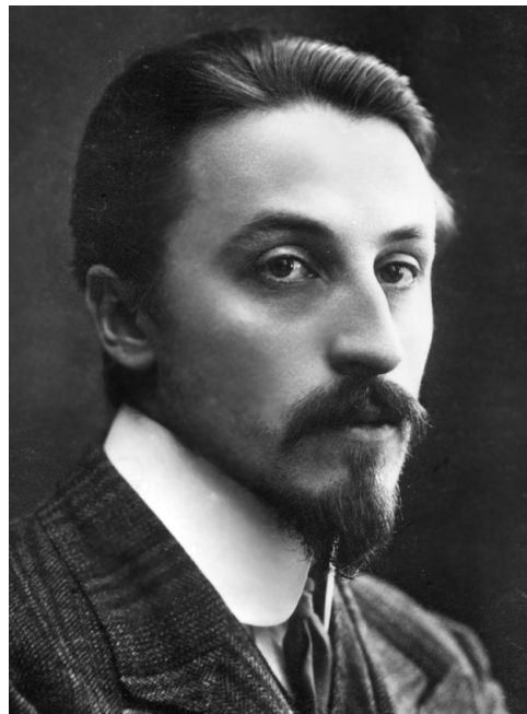
Б. К. Зайцев

Родился в дворянской семье (отец — горный инженер, управляющий мальцевскими металлургическими заводами), детство провел в имении родителей — с. Усты Жиздринского у. Калужской губ. Окончив в 1898 Калужское реальное училище, учился в Императорском Техническом училище в Москве, Горном ин-те в Петербурге, на юридическом ф-те Московского ун-та, но, не закончив его, предался всецело лит. деятельности. Первые рассказы З. были напечатаны Леонидом Андреевым в 1901 в московской газ. «Курьер». В 1900-х З. погружается в лит. жизнь Москвы и Петербурга, публикуется в самых различ-