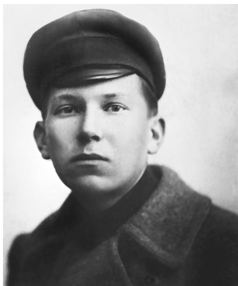
Г. А. Санников

СА́ННИКОВ Григорий Александрович [30.8 (2.9).1899, Яранск Вятской губ — 16.1.1969, Москва] — поэт.