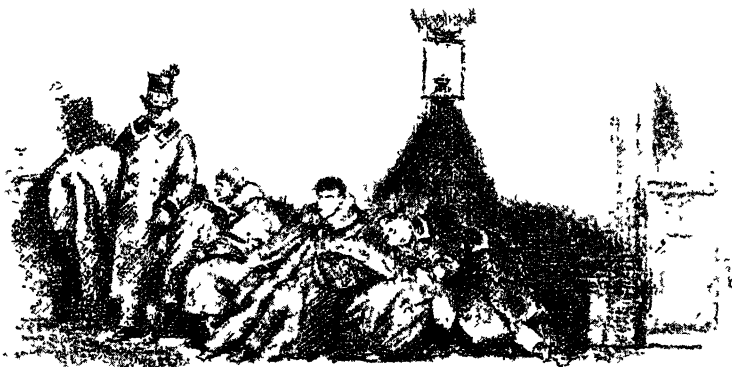
„Еще усталые лакеи на шубах у подъезда спят“. Рис. П. П. Соколова