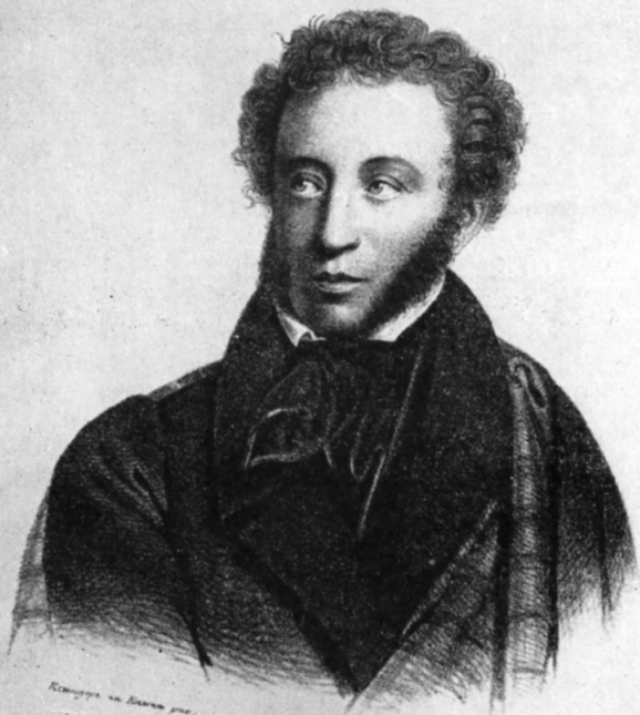
Александр Сергеевич ПУШКИНЪ.

исполн. по рис. на Ланге рис. С. Петербург Позволяет: исполн. по рис. на Ланге рис. Кекор Пешер Корсаков 14 февр. 1837 год