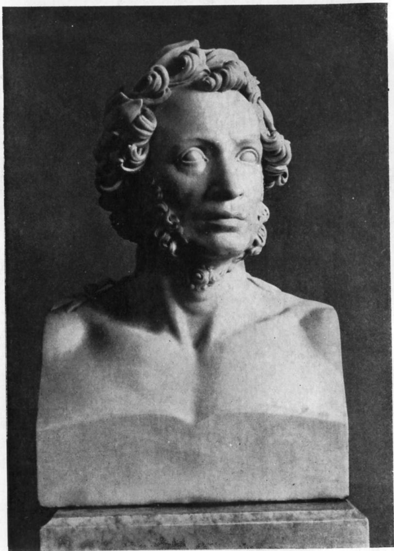
А. С. Пушкин. Бюст работы И. П. Витали. Мрамор, 1837 г. Всесоюзный музей А. С. Пушкина, Ленинград.