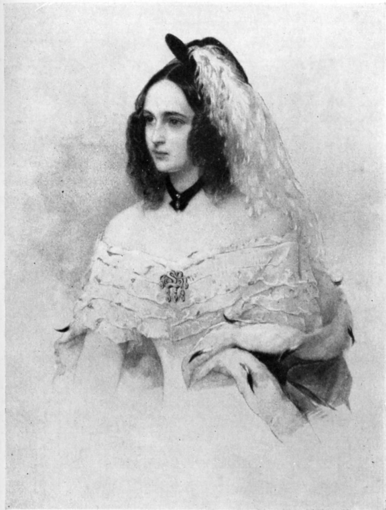
Н. Н. Пушкина. Акварель В. И. Гау, 1843 (?).

Всесоюзный музей А. С. Пушкина, Ленинград.