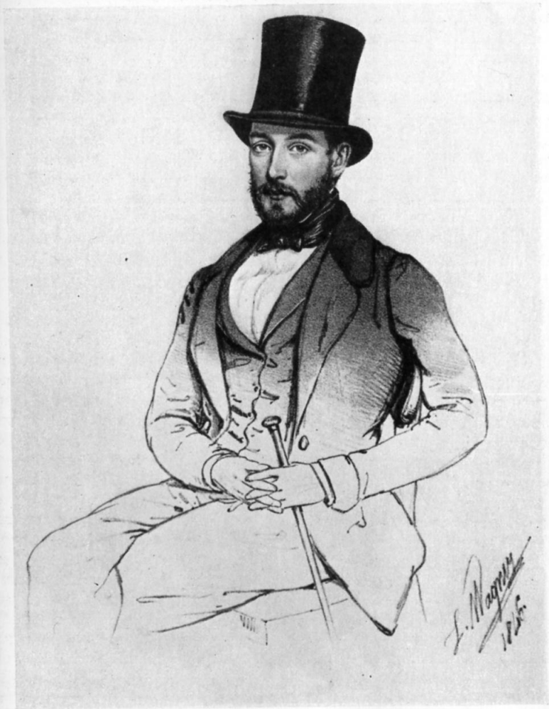
В. Н. Карамзин. Литография Л. Вагнера, 1846 г. ИРЛИ.