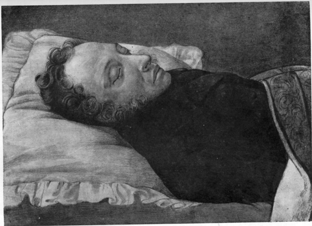
А. С. Пушкин на смертном одре. Рисунок А. А. Козлова, 30 января 1837 г. ИРЛИ.