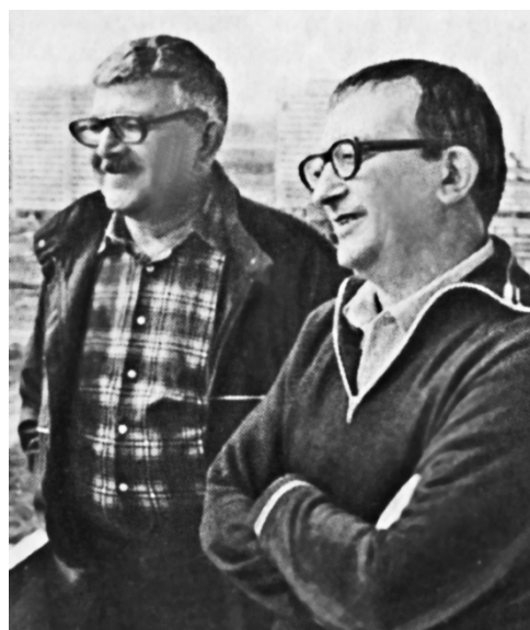
А. Н. и Б. Н. Стругацкие

Первые книги С. совмещали в себе традиции приключенческой повести о путешествии, мотив сенсационной тайны, удовлетворяли требованиям социалистического реализма. Отличительной особенностью этих книг от образцов тогдашней советской фантастики