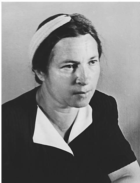
А. Л. Барто

Отец был ветеринарным врачом, в молодости ездил в Сибирь на борьбу с оспой. Знал лит-ру, любовь к русской классике привил дочери. Печататься начала в 1925 — сб. стихов « Китайчонок Ван Ли », « Мишка-воришка ». Затем вышли книги « Братишки » (1928), « Мальчик наоборот » (1934), « Снегирь » (1939). Уже в первых книгах автор следует собственной заповеди: «Сила лучших детских поэтов именно в том, что они в своем творчестве нашли сочетание детскости и взрослости, умеют со своим читателем