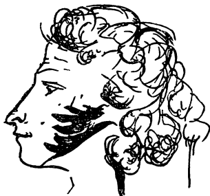
АВТОПОРТРЕТ А. С. ПУШКИНА 1829 г.

Когда в саду, в аллее нас Судьба свела, и так смиренно Урок ваш выслушала я? Сегодня очередь моя.