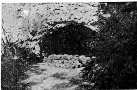
Грот Гоголя на вилле З. А. Волконской.