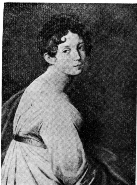
Портрет Зинаиды Александровны Волконской работы Ф. Бруни (частная коллекция, Рим).

Хозяйка запретила в нем только карты — бостон и вист, столь любимые московским обществом.