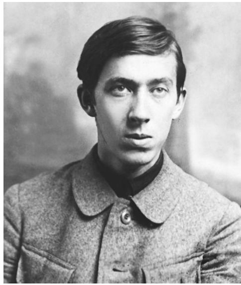
Г. Н. Петников

ПЕТНИКОВ Григорий Николаевич [25.1 (6.2).1894, Петербург — 11.5.1971, Старый Крым] — поэт, переводчик.