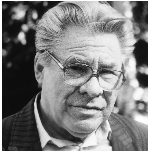
Е. И. Носов