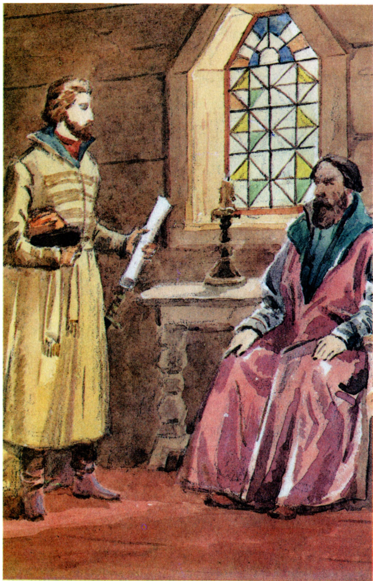
«Юрий Милославский, или Русские в 1612 году»