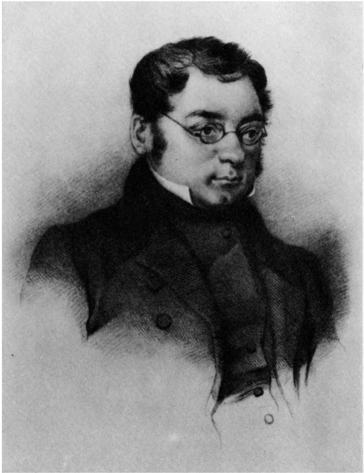
Пушкинский кабинет ИРЛИ