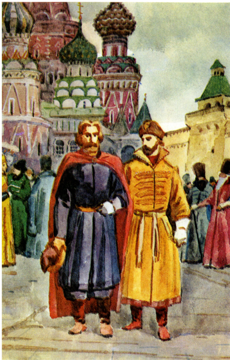
«Юрий Милославский, или Русские в 1612 году»