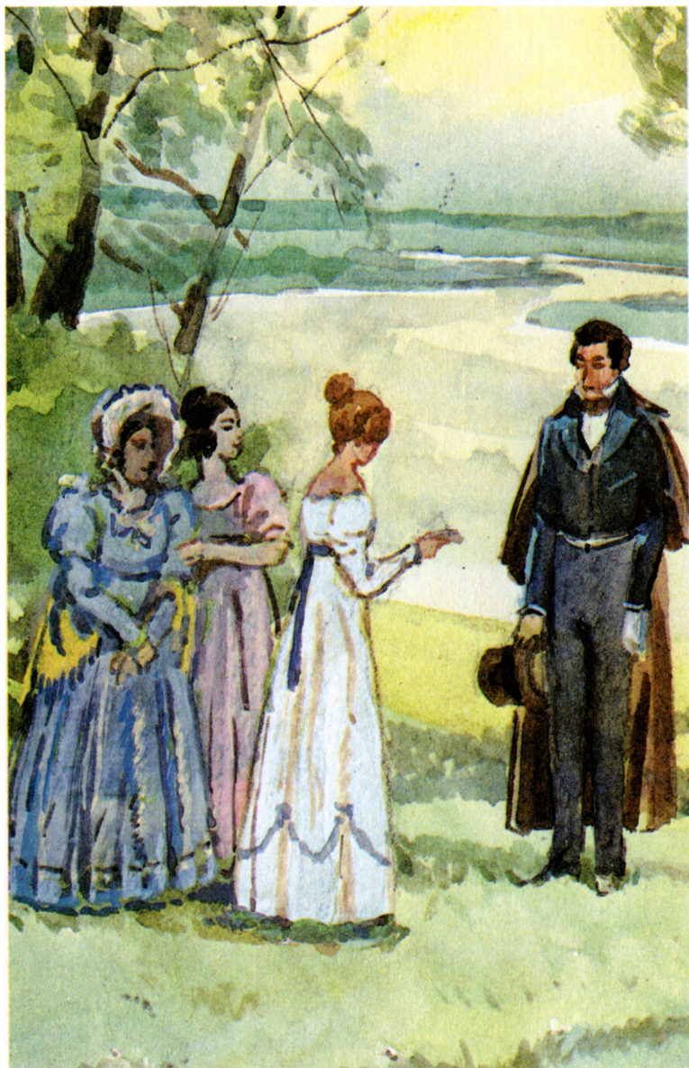
«Рославлев, или Русские в 1812 году»