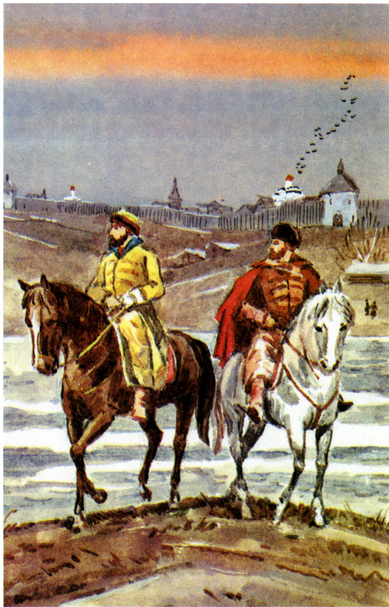
«Юрий Милославский, или Русские в 1612 году»