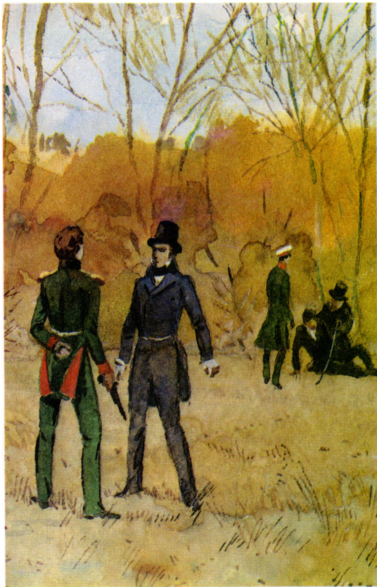
«Рославлев, или Русские в 1812 году»