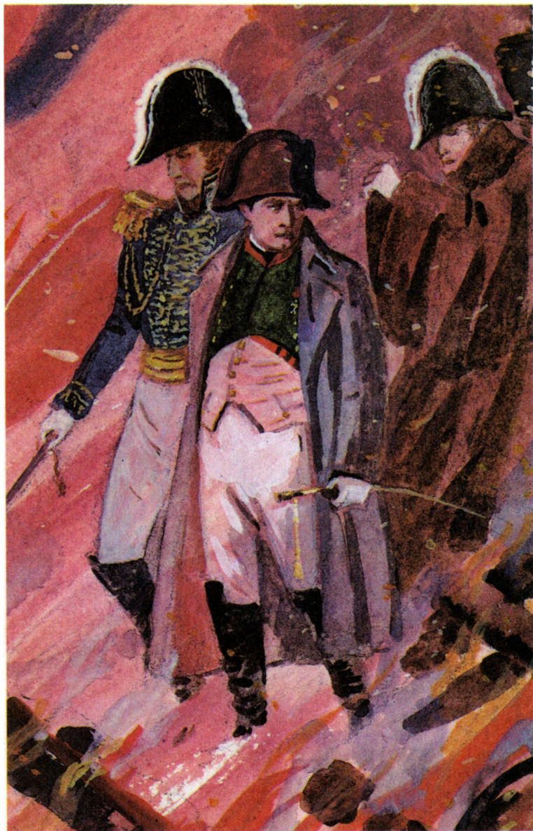
«Рославлев, или Русские в 1812 году»