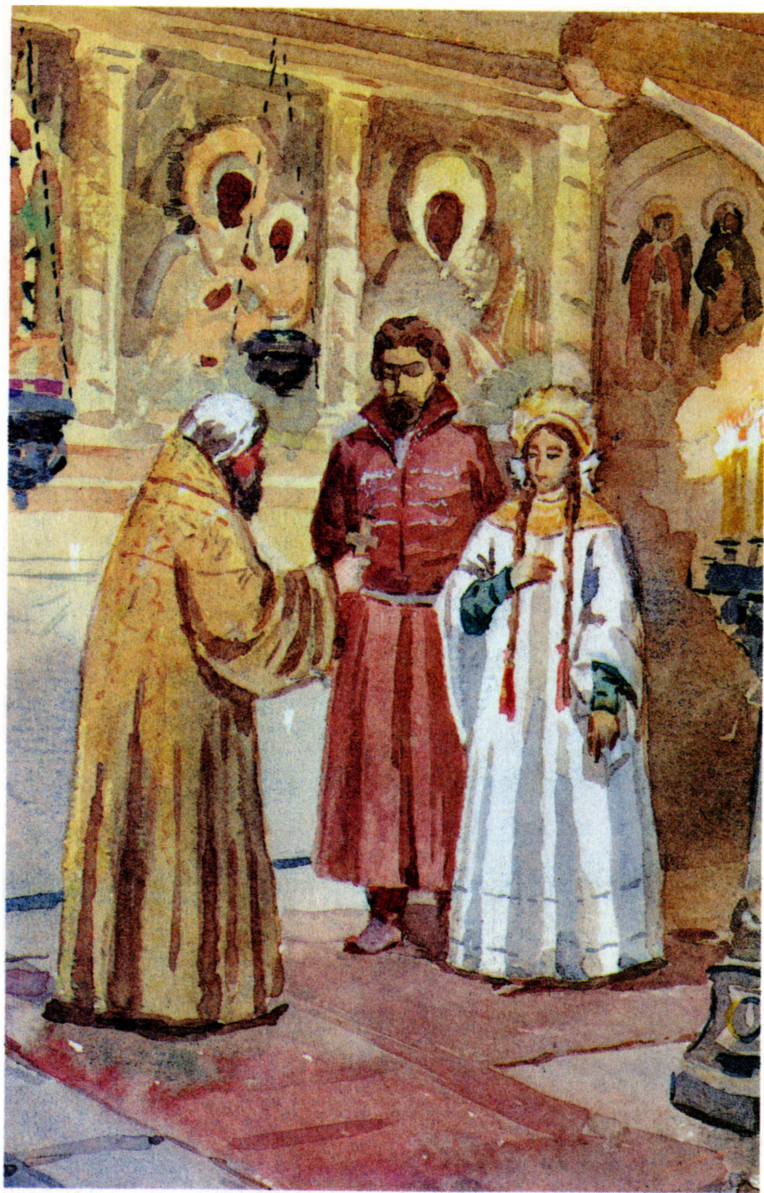
«Юрий Милославский, или Русские в 1612 году»