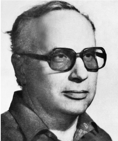
В. К. Железников

ресованы в основном младшим школьникам. Большинство же книг Железникова написаны для читателей-подростков, и герои их — подростки 12–13 лет.