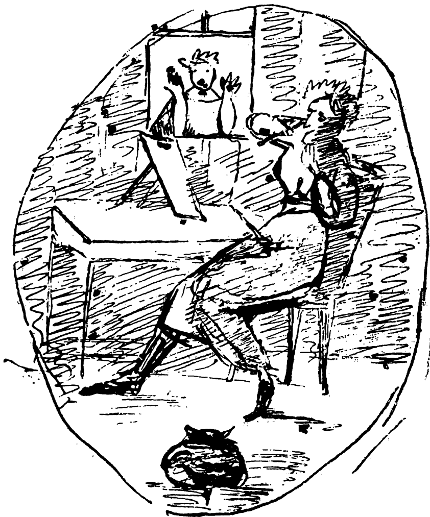
Рисунок Пушкина к «Дому в Коломне».