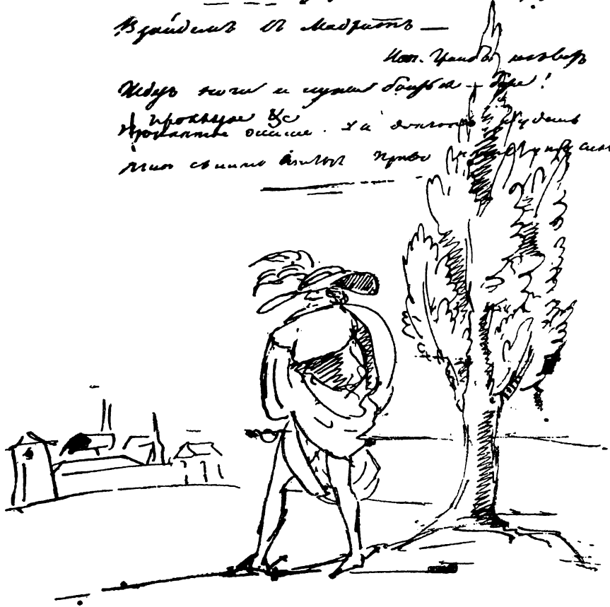
Страница из рукописи «Каменный гость» с рисунком Пушкина

Куда так и уходит бродит — Пробавит осяние. Да и в этом мне совсем будет будет будет будет будет будет