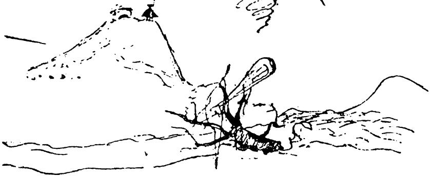
Рисунки Пушкина. Страница из рукописи «Кавказский пленник»

примечания и иногда в рукописи и иногда в других местах и иногда в других местах и иногда в других местах