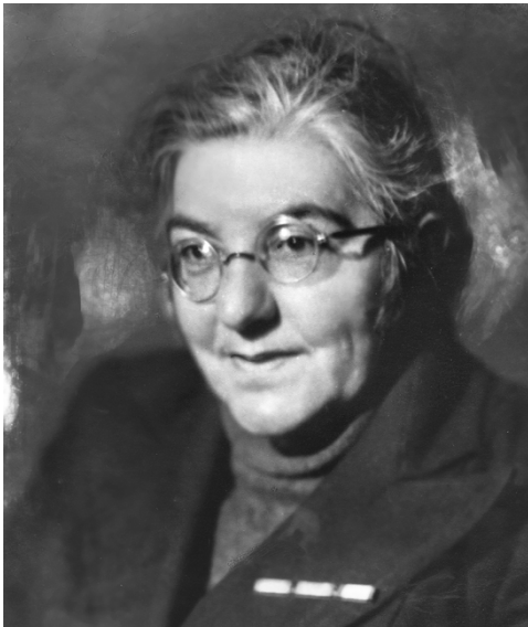
М. С. Шагинян

27 июля 1903 в газ. «Черноморское побережье» появляется первая публикация