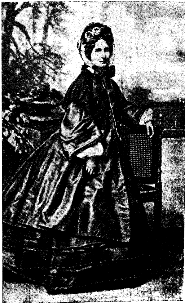
Н. Н. ПУШКИНА (ЛАНСКАЯ) В СТАРОСТИ Фотография из альбома П. А. Вяземского Государственный Литературный музей,