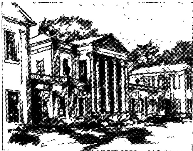
Дворец Загряжских (впоследствии Н. И. Гончаровой) в имени Ярополец

чительны письма Натальи Николаевны. Жизнь Пушкина, подробности его биографии запечатлены во многих воспоминаниях и письмах его современников. Однако среди них до сих пор отсутствовали свидетельства жены — самого близкого ему человека. Авторы-составители пишут: «Целью нашей работы были поиски новых данных о Пушкине и его окружении... Среди писем пушкинского окружения особый интерес представляют письма Натальи Николаевны, о которой до сих пор мы мало знали достоверного. Это чрезвычайно ценный материал, по-новому освещающий образ жены поэта». Благодаря труду авторов книги, сейчас есть документы, которые говорят об отношении Натальи Николаевны к мужу. Приводим текст письма от июля 1836 года Н. Н. Пушкиной.