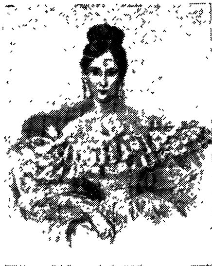
Н. Н. Пушкина (Худ. А. Брюллов)

Да, она была молода, была прекрасна и бесконечно радовала, чаровала Пушкина своей молодостью и красотой. Да, как он и хотел, она блистала в той сфере, где была к этому призвана. Она очень любила балы, наряды, любила кокетничать со своими бесчисленными поклонниками. Глубочайше потрясенная смертью мужа, она сама горько каялась в этом. Но — мать четырех детей поэта — она давала ему то высокое и вместе с тем то простое, доброе, человеческое счастье, в котором он так нуждался, пуждался именно в годы жизни с ней — в 30-е годы, когда своей мыслью и творчеством ушел далеко вперед — в грядущие столетия, а в своем веке ощущал такое страшное одиночество. Один раз за всю их семейную жизнь увлеклась было и она, но и в этом увлечении явила себя его „милым идеалом“, его Татьяной. А в истории трагической гибели Пушкина она была не виновницей, а жертвой тех дьявольских махинаций, тех адских козней и адских пут, которыми был опутан и сам поэт. О ней, о ее будущей судьбе были последние помыслы и последние заботы умирающего Пушкина.