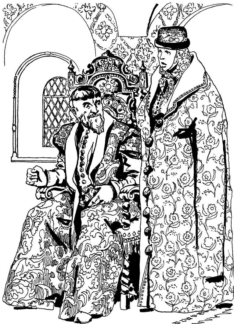
Illustration of a man and a woman in ornate, patterned clothing, likely from a 19th-century book.