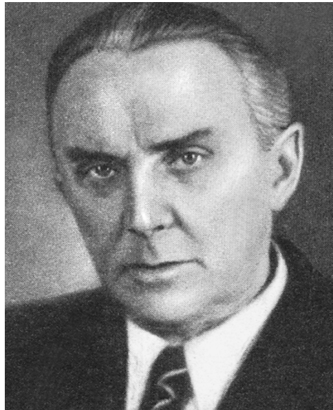
К. А. Федин

Первый рассказ был написан в 1910, это было подражание гоголевской «Шинели»; первые публикации — в «Новом сатириконе» в 1913–14 («мелочи» и стихи).