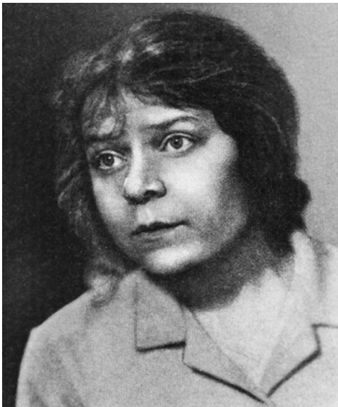
Н. Н. Матвеева

Стихи начала писать в детстве. О своем детстве, отце и матери, о худож. атмосфере в семье М. рассказала в поэмах « Ключи от клуба » и « Вещи в доме ». Автобиографический характер имеет книга М. « Мяч, метавшийся в небе », опубликованная в 1996–97 в ж. «Знамя». Печататься начала в 1958. В 1961 вышел первый сб. « Лирика », за которым последовали « Кораблик » (1963), « Душа вещей » (1966), « Ласточкина школа » (1973), « Река » (1978), « Закон песен » и « Страна прибора » (1983), « Хвала работе » (1987), « Нерасторжимый круг » (1991), « Менуэт » (1994) и др. М. написаны, но пока не опубликованы 2 пьесы и роман « Союз действительных ».