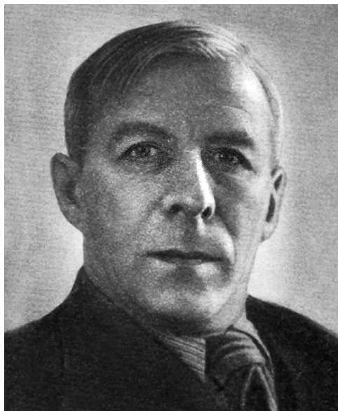
Н. Н. Асеев

АСЕЕВ Николай Николаевич [28.6(10.7). 1889, г. Льгов Курской губ.— 16.7.1963, Москва] — поэт.