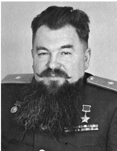
П. П. Вершигора

Родился в семье сельских учителей. В 12 лет остался круглым сиротой, зарабатывал на пропитание пастушеством, работал на мельнице. В 1920 поступил в профагрошколу, из-за голода и тифа учеба была прекращена. До 1925 жил на родине отца в с. Севериновка, работал избачом, председателем сельсовета, реж. драмкружка. Затем пошел добровольцем в Красную Армию, служил