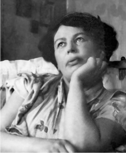
Е. А. Нагродская

НАГРОДСКАЯ Евдокия Аполлоновна [1866, Петербург — 1.5.1930, Париж] — поэтесса, прозаик.