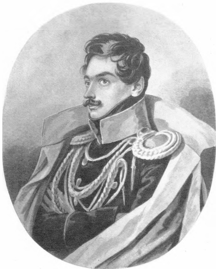
Павел Александрович Нащокин. Портрет П. Ф. Соколова (?). (Гос. Исторический музей, Москва).