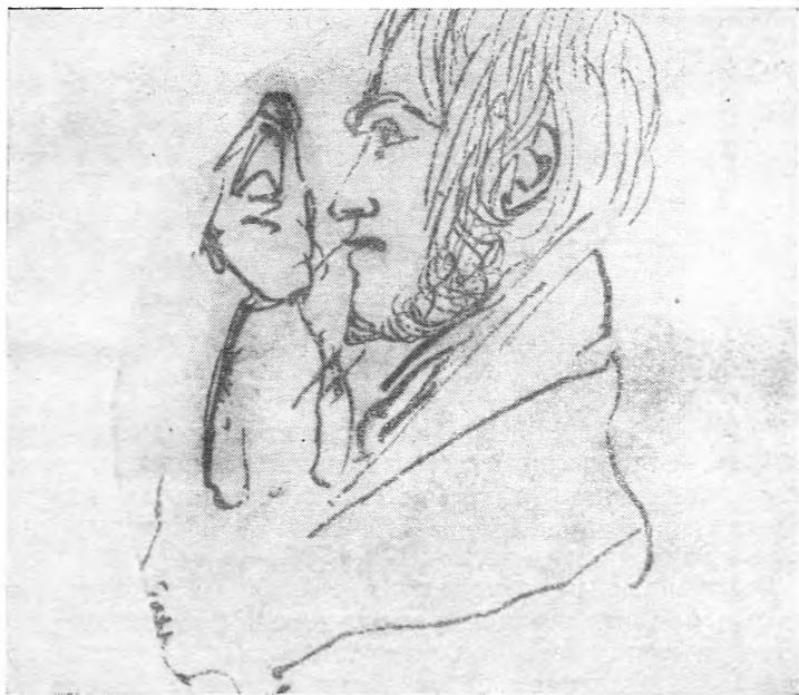
Павел Воинович Нащокин. Рисунок Пушкина в альбоме Ел. Н. Ушаковой. 1827—1830. (ИРЛИ).

торский вариант «меморий». 13 Однако для целей настоящей работы, посвященной взаимоотношениям Пушкина и Нащокина, особое значение имеет второй, пушкинский вариант этих «Записок», имеющий поправки и пометы самого поэта, видимо предполагавшего напечатать их в «Современнике». В дальнейшем мы будем пользоваться именно этим текстом нащокинских «меморий». 14