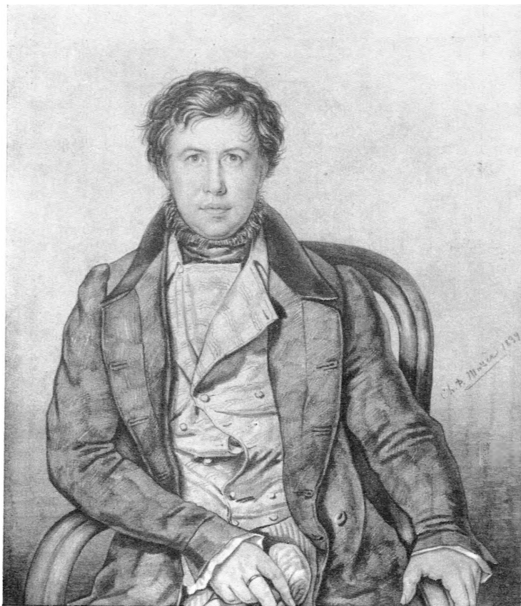
Павел Воинович Нащокин. Рисунок К. П. Мазера. 1839 г. (Всесоюзный музей А. С. Пушкина, Ленинград).