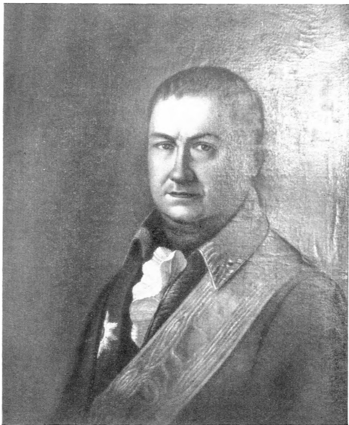
Воин Васильевич Нащокин. Фотоснимок, сделанный с портрета неизвестного художника конца XVIII в. — 1800-х годов.