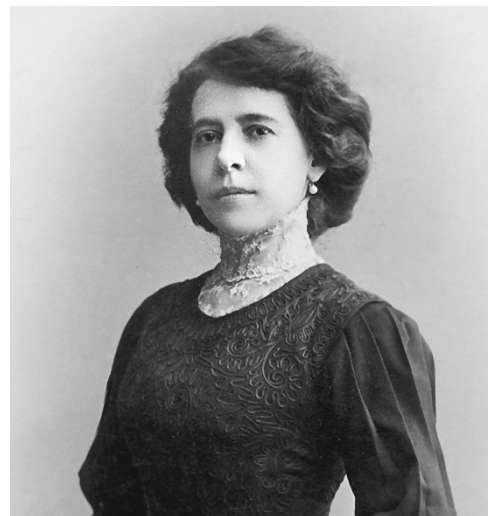
Л. А. Чарская

ЧАРСКАЯ Лидия Алексеевна (урожденная Воронова, в замужестве Чурилова) [1875 (точная дата неизвестна), Царское Село — 18.3.1937, Ленинград; похоронена на Смоленском кладбище] — прозаик, поэтесса.