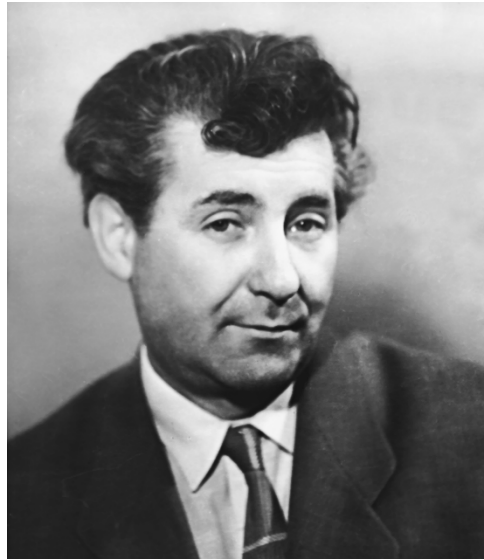
А. Н. Арбузов

АРБУЗОВ Алексей Николаевич [13(26).5. 1908, Москва — 20.4.1986, Москва] — драматург.