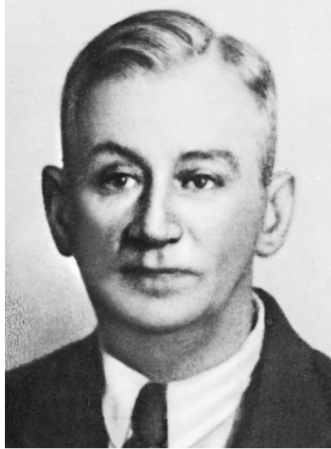
А. И. Несмелов