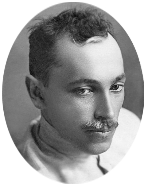
Г. А. Вяткин

ВЯТКИН Георгий Андреевич (псевдонимы В., Г.В., Г.В-ин) [13(25).4.1885, Омск — 24.10.1941, в заключении] — поэт, прозаик, критик.