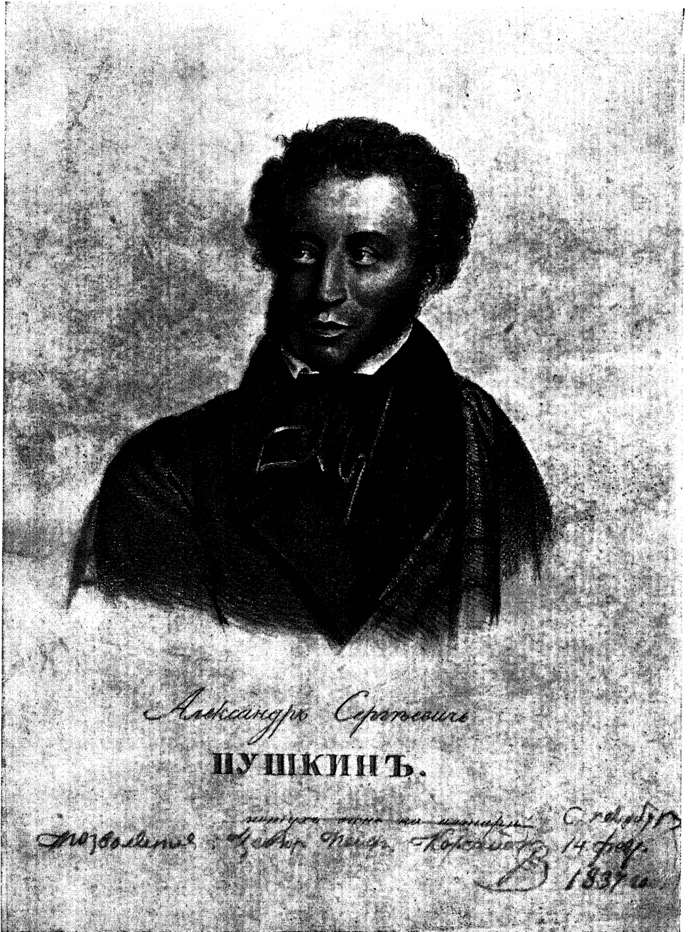
Цензурные купюры на портрете Пушкина, напечатанном через несколько дней после смерти поэта