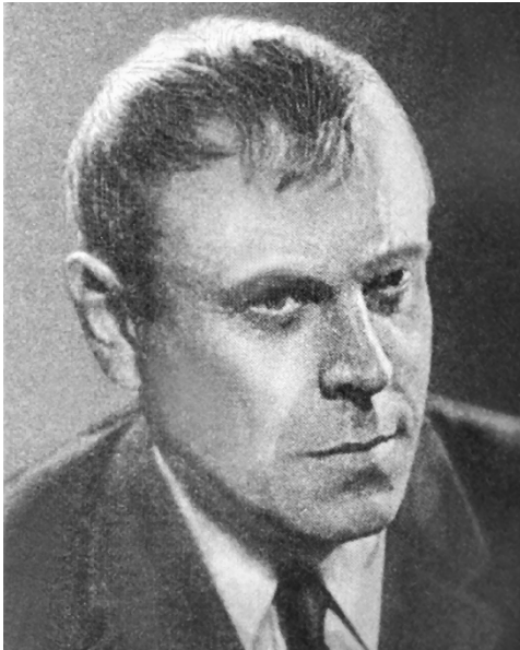
В. А. Солоухин

Родился в крестьянской семье. После окончания школы учился во Владимирском механическом техникуме, получил специальность механика-инструменталиста. Во время Великой Отечественной войны служил в войсках особого назначения, охранявших Кремль. С 1946 начал печатать стихи (первая публикация — стих. «Дождь в степи» в «Комсомольской правде»), которые писал со школьных лет. В 1946–51 учился в Лит. ин-те им. М. Горького. В 1952 вступил в КПСС. После окончания ин-та работал разъездным корреспондентом-очеркистом, писал репортажи о поездках по стране и за границе. Первый сб. стихов С. «Дождь в степи» (1953) написан в традиционной манере. Критика отмечала в стихах «тонкую прелесть образа». Выходят сб. «Разрыв-трава» (1956), «Ручьи на асфальте» (1958), «Журавлиха» (1959) и др. В ранней лирике обнаруживается стремление к постановке таких проблем,