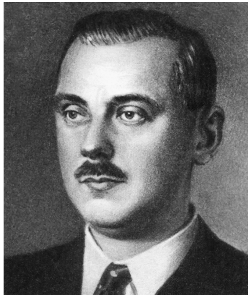
С. В. Михалков

Отец был ученым-птицеводом; характерное воспоминание поэта: «Мне двенадцать лет. Я хожу по домам подмосковного поселка