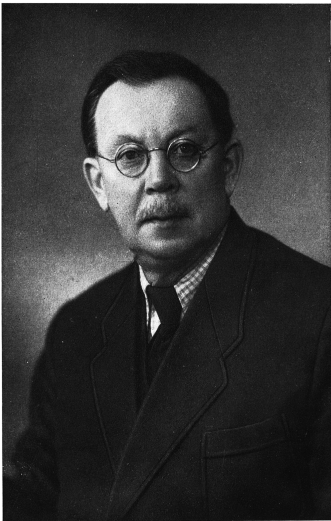
Б. В. Томашевский.