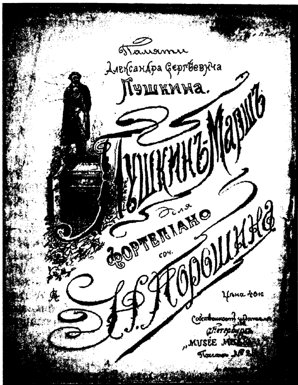
Порошин Н. Пушкин – марш для фортепьяно.