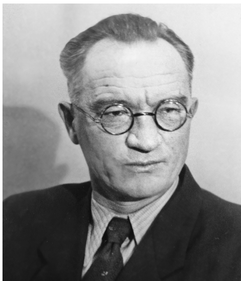
Г. Н. Троепольский

ского у. Тамбовской губ., ныне Воронежской обл.— 30.6.1995, Воронеж] — прозаик, публицист.