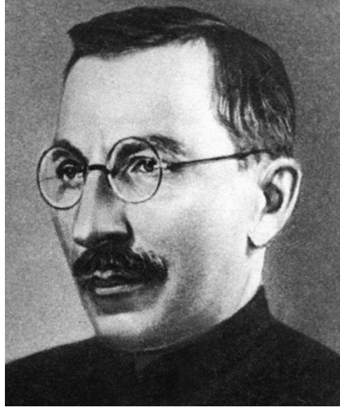
А. С. Макаренко

Отец М. — маляр-полировщик вагонных мастерских, участвовал в забастовках 1905. М. окончил в 1904 4-классное училище в г. Кременчуге (в 1901 отец был переведен в г. Крюков Посад Кременчугского у.). После окончания в 1905 одногодичных педагогических курсов работает учителем в железнодорожном училище; принимает активное участие в подготовке съезда учителей; в 1911–14