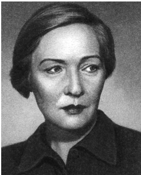
О. Ф. Берггольц

Отец — потомок обрусевшего шведа, взятого в плен при Петре I, был заводским врачом, мать — учительница кройки и шитья при заводской школе. Детство прошло за Невской заставой, населенной заводским людом. Писать стихи начала рано. Первое стих. «Пионерам» появилось в газ. «Ленинские искры» 27 сент. 1925. С этого времени она постоянно печаталась в детских и молодежных изд.— «Ленинские искры», «Смена», «Юный пролетарий», «Комсомольская правда» и др. В 16 лет вступила в группу «Смена», которой руководил И. Садофьев, затем В. Саянов. Член группы Б. Корнилов стал ее мужем. В знаменитой песне Б. Корнилова из