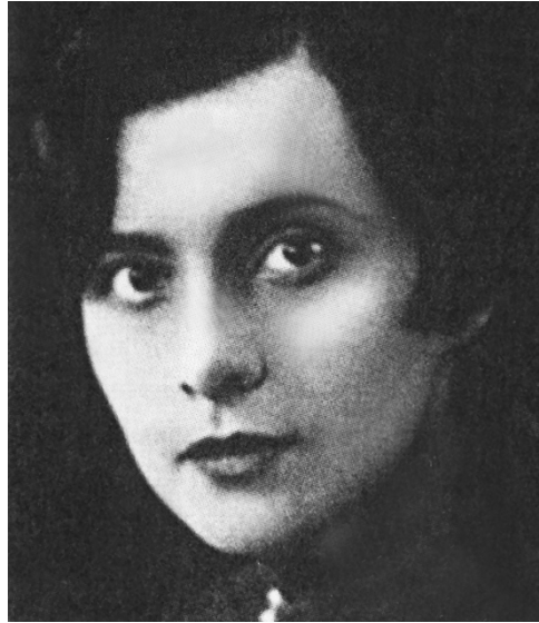
Н. Н. Берберова

БЕРБЕРОВА Нина Николаевна [26.7(8.8). 1901, Петербург — 26.9.1993, Филадельфия] — поэт, прозаик.