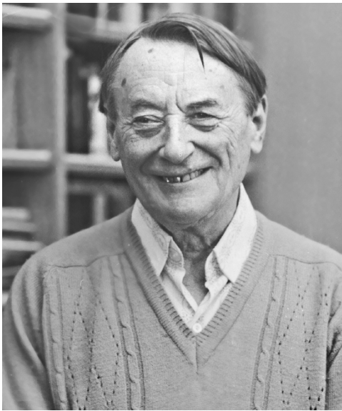
В. С. Шефнер

ния, дышащие предошущением войны. В них проявлялась близость автора как к его ровеснику К. Симонову, так и к более молодым (Н. Майоров, П. Коган, М. Кульчицкий). Здесь «багровый отсвет звезд пятиконечных / И шум непобеждаемых знамен» (« Легенда о мертвых морях Британии », « Могила бойца », « Тревога »). Но в « Светлом берегу » (1940) оказались и стихи другого плана: « Цветные стекла », « Болото », « Подсолнечник », где властвовали «невидимая дрожь существования», ощущение таинственности мира. То же характеризовало поэзию Ш. военных лет: сб. « Защита » (Л., 1943) и др. стихи. Жестокая политическая обнаженность в стихотворных агитках и глупое философское содержание в стихах « Зеркало », « Шиповник », « Первая любовь », « Мрамор », где конкретные сюжеты и детали военной поры наполнились общежитийным содержанием. Неспроста после появления книги Ш. « Пригород » (1946) в связи с развязанной правительством «борьбой с космополитизмом» поэта стали печатать редко.