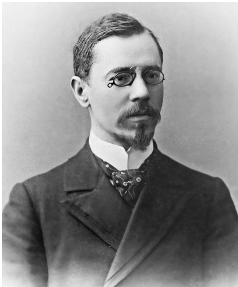
Е. А. Ляцкий

Л. родился в семье дворянина-землевладельца и был дальним родственником поэта Л. А. Мея. С 16 лет Л., будучи еще гимназистом, увлекся изучением народного творчества и самостоятельно ездил в фольклорные экспедиции. В 1889–93 учился на словесном отделении историко-филол. ф-та Московского ун-та. После окончания учения Л. был оставлен при ун-те по предложению известного