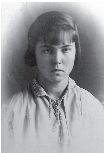
Ирина Пушкина (1920-е гг.)