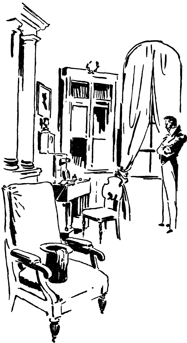
Пушкинский кабинет ИРЛИ