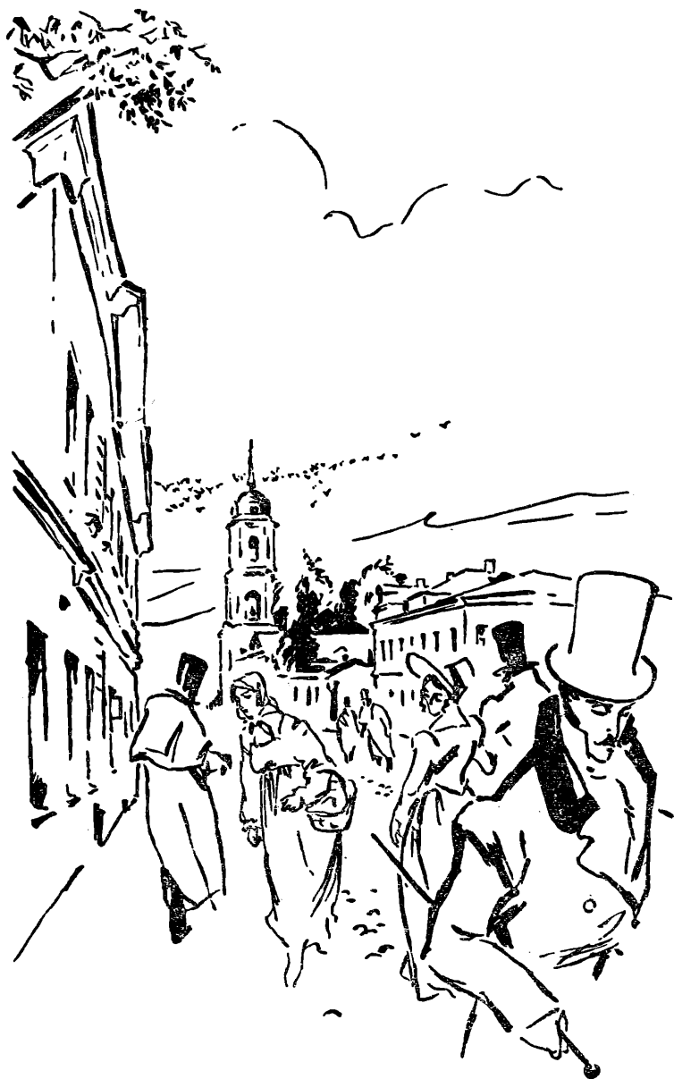
Пушкинский кабинет ИРЛИ