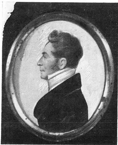
Вверху: Н. И. Надеждин. Непзв. художник. Масло. 1830-е гг.; П. Я. Чаадаев. Литография. 1830-е гг. Внизу: Н. А. Полевой. Гравюра. 1839; П. И. Шаликов. Непзв. художник. Миниатюра. 1810-е гг.