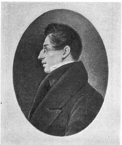
Вверху: Е. П. Ростопчина, Литография, 1840-е гг.; Д. В. Голицын, Неизв. художник, Масло, 1830-е гг. Внизу: Е. С. Семёнова, Гравюра П. И. Уткина, 1816; М. А. Максимович, Фотогения с портрета 1830-х гг.