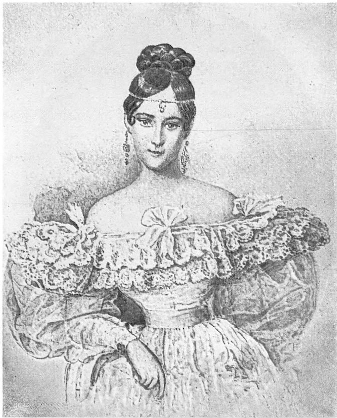
Н. Н. Пушкина А. П. Брюллов. Акварель. 1831—1832