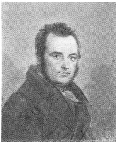
Вверху: А. Я. Булгаков. Гравюра А. А. Афанасьева. 1820-е гг.; П. П. Вяземская. Ф. Бруш. Акварель. 1835 Внизу: В. Ф. Вяземская. А. Молишари. Акварель, 1800-е гг.; С. Н. Глинка. В. П. Лангер. Акварель. 1820-е гг.