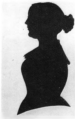
А. Н. Гончарова Неизв. художник. Силуэт. 1840-е гг.