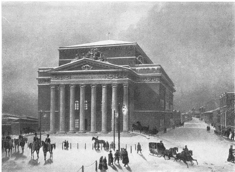
Благородное собрание. Литография