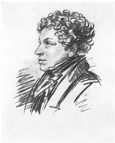
Верху: Д. В. Давыдов. В. П. Лангер. Акварель, 1819; П. М. Языков. Литография, 1840-е гг. Внизу: П. А. Вяземский. Литография, 1830-е гг.; Л. С. Пушкин. А. О. Орловский. Рисунок, 1820-е гг.