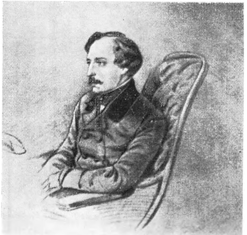
И. Н. Гончаров Н. Ланской. Рисунок. 1852