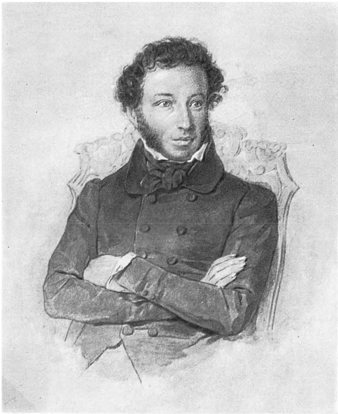
А. С. Пушкин П. Ф. Соколов. Акварель. 1830—1836