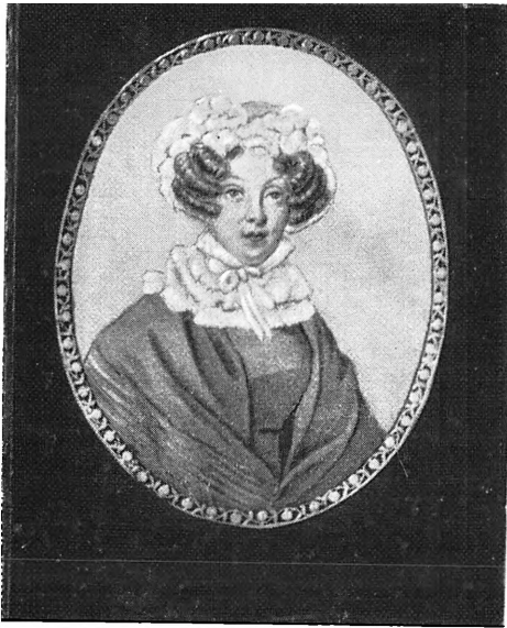
П. И. Гончарова Пензл. художник. Акварель. 1820-е гг.