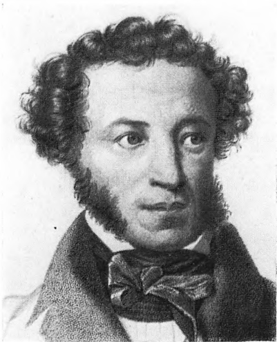
Портреты А. С. Пушкина Вверху: Ж. Вншн. Миниатюра. 1826; О. А. Кипренский. Масло. 1827 Внизу: В. А. Тропинин. Масло. 1827; Гравюра Г. Райта. 1836—1837