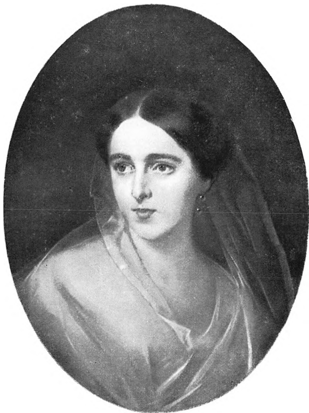
Н. Н. Пушкина И. К. Макаров. Масло. 1849