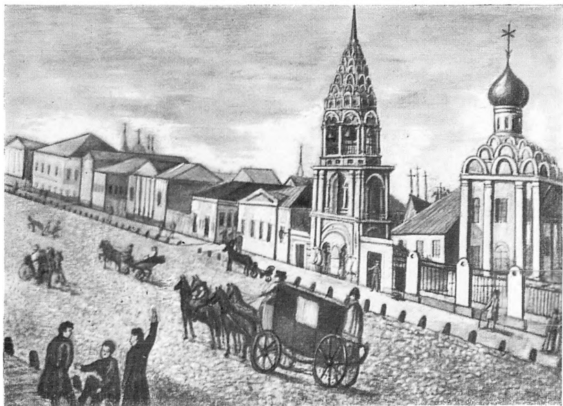
Тверской бульвар. Литография А. Кадоля. 1825