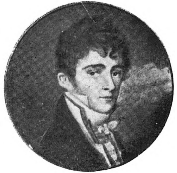
П. А. Гончаров Миниатюра. 1800-е гг.